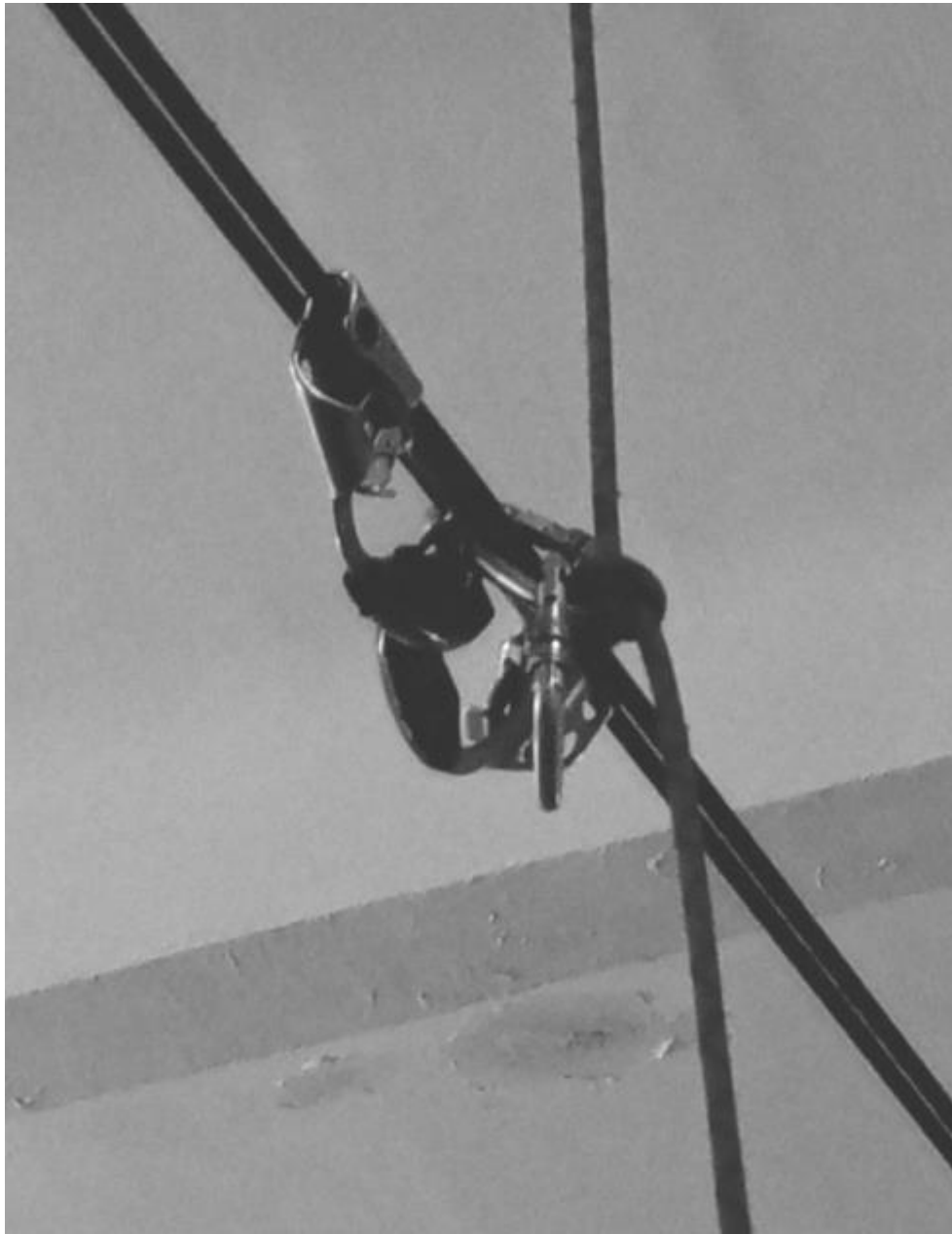
Схема ТО-6 1 класс дистанции